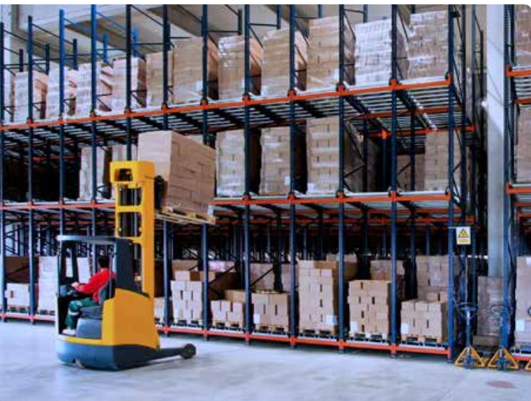
DECT XQ sorgt für hohe Sprachqualität in reflektierenden Umgebungen.

Ein DECT-Funknetz kann auch Bereiche außerhalb von Gebäuden abdecken. Dabei kommen spezielle Outdoor-Basisstationen mit einem erweiterten Temperaturbereich im Wetterschutzgehäuse zum Einsatz. Einige Basisstationen lassen sich durch externe Antennen mit unterschiedlicher Funkcharakteristik perfekt an die speziellen Anforderungen des Standortes und des Funknetzes anpassen.